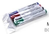
(SETFIXWB) MARKER PENS BOARDMARKER