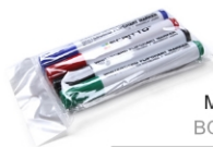
(SETFIXWB) MARKER PENS BOARDMARKER