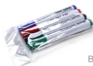
(SETFIXWB) MARKER PENS BOARDMARKER