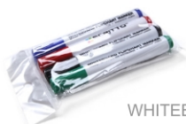
(SETFIXWB) MARKER PENS WHITEBOARDMARKER-SET