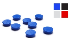
(MAGNETS) MAGNETS MAGNETE