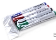
(SETFIXWB) MARKER PENS BOARDMARKER