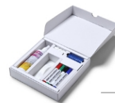
(STARTERKIT) STARTERKIT STARTPACKUNG