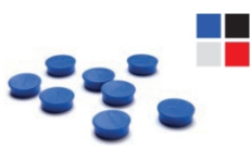
(MAGNETS) MAGNETS MAGNETE

i NOTE: ELECTRICAL CONNECTION MUST BE INDOOR. PRODUCT CAN NOT BE EXPOSED TO RAIN. ACHTUNG: DER ELEKTRISCHE ANSCHLUSS MUSS IM INNENBEREICH ERFOLGEN. PRODUKT KANN NICHT DEM REGEN AUSGESETZT WERDEN.