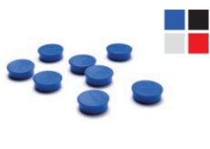
(MAGNETS) MAGNETS MAGNETE